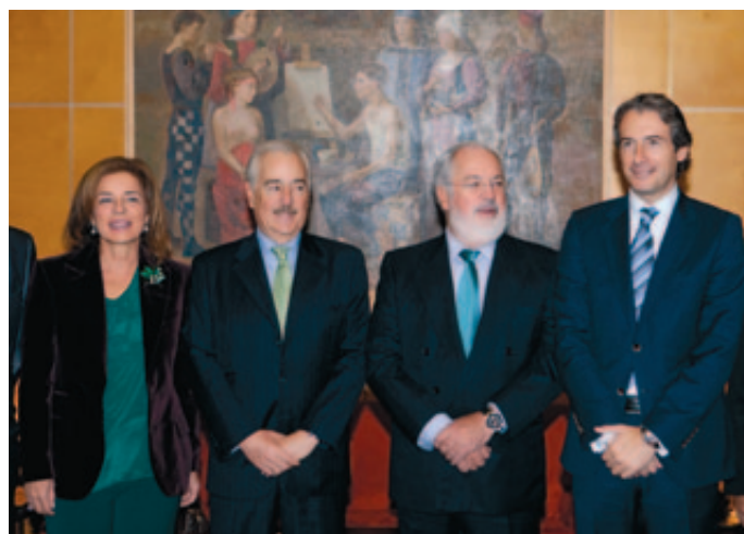
Ana Botella, el expresidente de Colombia, Andrés Pastrana, Miguel Arias Cañete e Íñigo de la Serna.

El Ministro se refirió a la importancia económica de la ecoindustria en Europa al citar un estudio de la Comisión Europea, en el que se estima el valor de la actividad en este sector en más de 300.000 millones de euros anuales, "un tercio del mercado global de tecnologías medioambientales", destacó. Pero, además, según afirmó, es un mercado "que crece a tasas anuales del 7% desde el año 2000, con expectativas de triplicarse para 2030, y que puede generar en los países de la Unión Europea cerca de