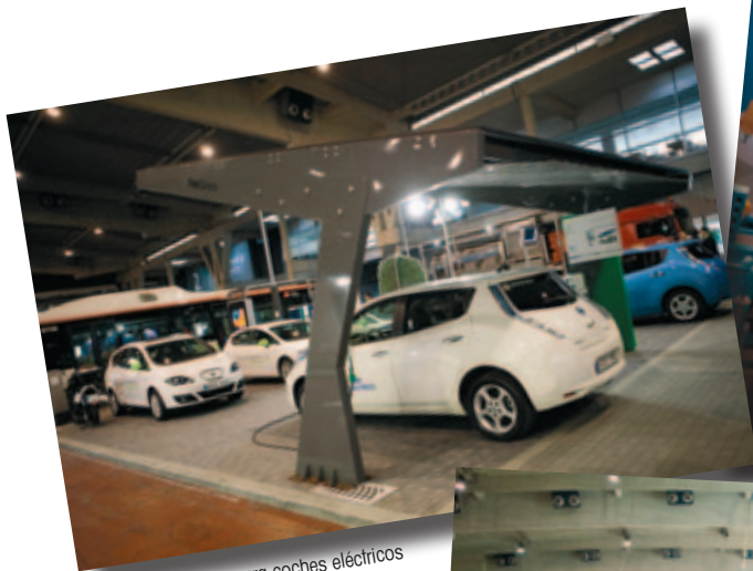
Estación de carga para coches eléctricos