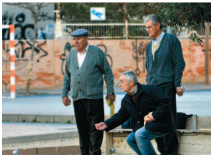
Juego de petanca en el parque de una ciudad española.

En la categoría "Encuentros Intergeneracionales en las Escuelas" , se alzó con el primer premio el proyecto finés "Gravity Racer" , que relata el trabajo desarrollado por estudiantes de 12 años con el abuelo Hannu Gustafsson, con el que aprendieron juntos durante la construcción de un coche goitibera. El estonio Bruno Poder, por su parte, que continuó trabajando hasta los 80 años como cirujano, sin perder su actitud positiva ni su ilusión