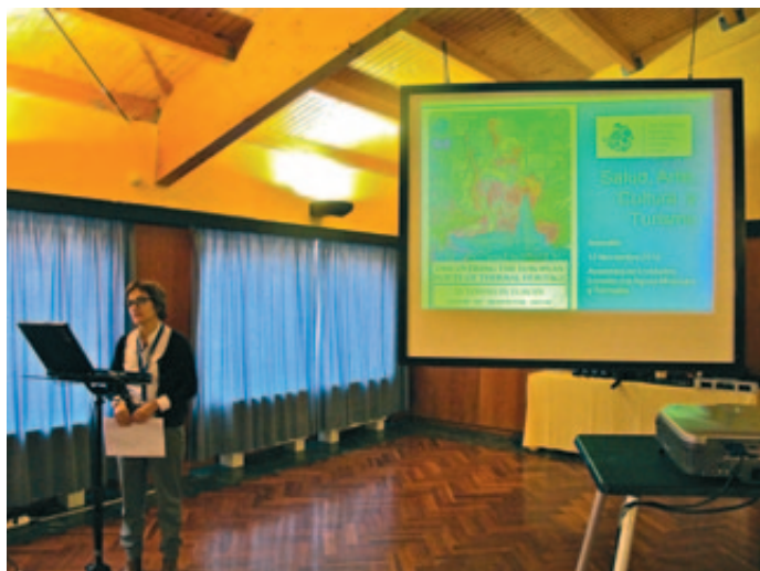
Nita Torres, Presidenta de la Red Europea de Ciudades Termales, durante su intervención.