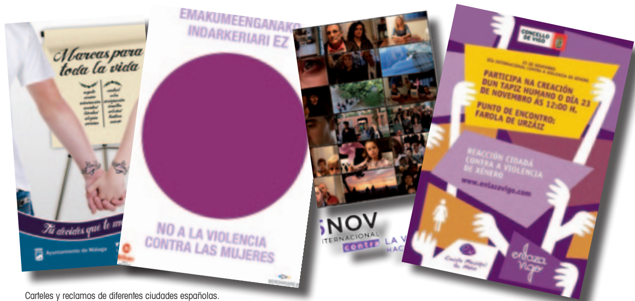
Carteles y reclamos de diferentes ciudades españolas.

Manifiestos, conferencias, campañas de sensibilización con carteles y actos públicos, tertulias y movilización a través de redes sociales fueron algunas de las iniciativas que Ayuntamientos de toda España desplegaron en torno a la jornada del pasado 25 de noviembre con motivo del Día Internacional contra la Violencia de Género.