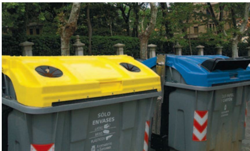
Ecoembes ha instalado 331.400 contenedores amarillos y más de 168.400 contenedores azules en nuestro país.