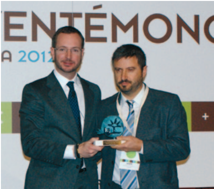
El Alcalde de Coca recibe el premio de manos del Alcalde de Vitoria.