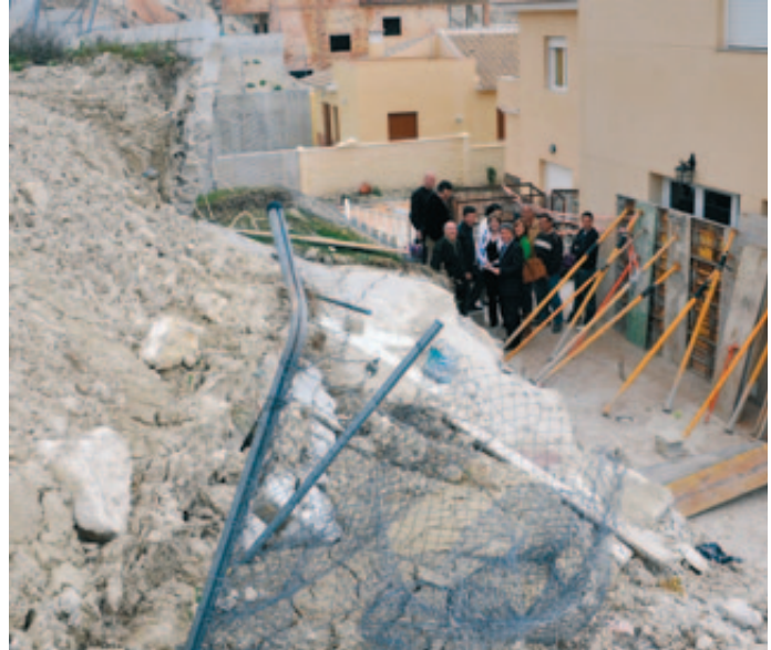
Representantes de la Diputación de Córdoba visitan una vivienda afectada por corrimiento de tierras en 2010.

Cuando se considere adecuado, el Servicio de Riesgos y Seguros ayudará al asegurado en las reuniones que se programen con el perito del asegurador, aportando sus conocimientos, profesionalidad y relación con el asegurador, defendiendo en todo momento los intereses del asegurado.