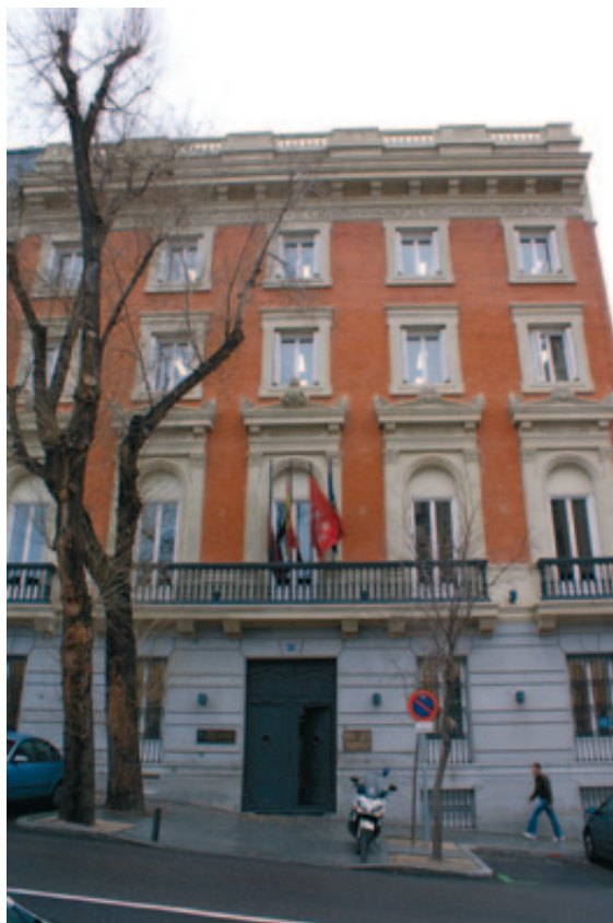
Sede del Tribunal Económico-Administrativo Municipal de Madrid (TEAMM).

Como se sabe, las sentencias del Supremo se remiten a la decisión del Tribunal de la UE de 12 de julio pasado sobre las cuestiones prejudiciales planteadas por el Tribunal Supremo español sobre los recursos planteados por las operadoras a las Ordenanzas de los Ayuntamientos citados.