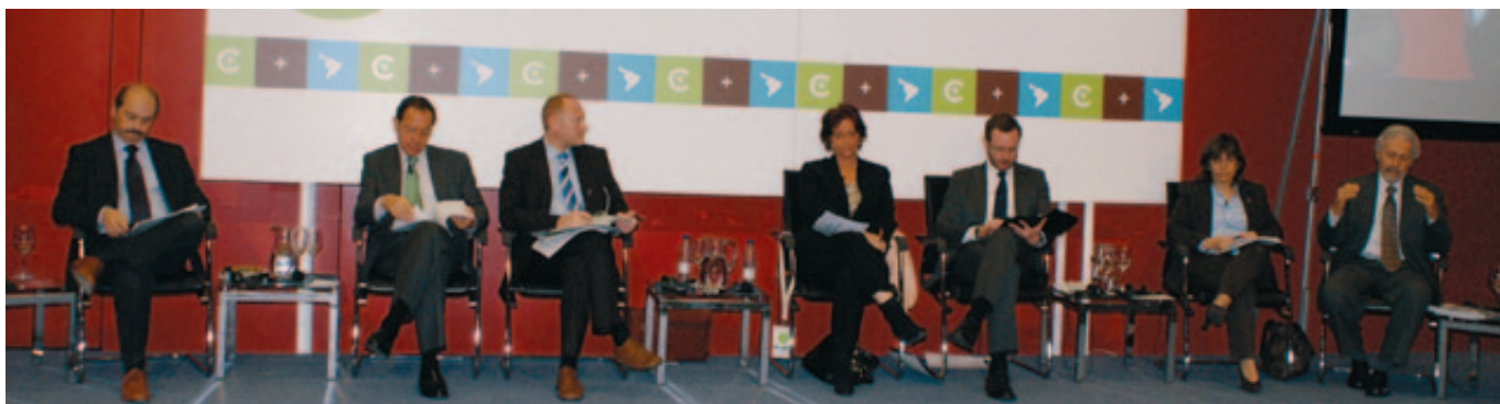
Participantes en la mesa sobre liderazgo.

El Alcalde de Vitoria defendió la participación de los ciudadanos, a través de los mecanismos institucionales establecidos y por medio de redes o grupos de interés. "Vitoria no sería 'European Green Capital' si no hubiera habido participación y complicidad ciudadana" , explicó, pero también el compromiso de todo el tejido económico y social, "sin ella, no habiéramos alcanzado el patrocinio de 52 millones de euros" , concluyó.