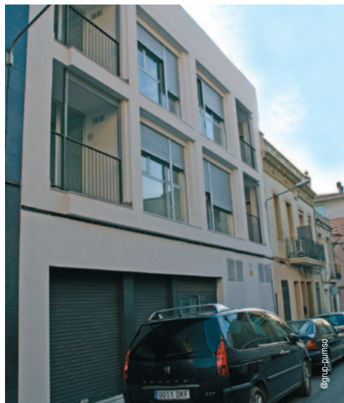
Edificio de VPO en alquiler, promovido en Mataró, cuya eficiencia energética le ha permitido ser finalista en una de las categorías de los IV Premios a las Buenas Prácticas Locales por el Clima.

Zaragoza Movilidad Sostenible, el proyecto finalista de Movilidad, surgió con el objetivo de disminuir las emisiones de CO 2 , mejorar la calidad del aire, reducir niveles de ruido, disminuir el uso de combustibles fósiles y evolucionar hacia una movilidad sostenible –mejorando al mismo tiempo los servicios de transporte de la ciudad- o fomentar la intermodalidad.