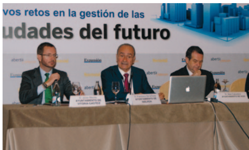
Los Alcaldes de Vitoria, Málaga y Vigo, en la jornada de debate.

Esto es positivo tanto para Vitoria como para sus empresas, responsables de la implantación de los sistemas que la han llevado a ser Green Capital , y, además, favorece la llegada de aportaciones privadas por la vía de la esponsorización, “crea riqueza” , a decir de su Alcalde que, además, explicó que las ciudades inteligentes exportan tecnología y muestran un “nuevo modelo de hacer ciudad” . ★