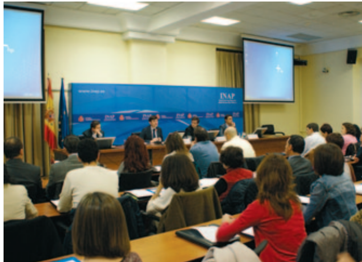
Acto de apertura de la jornada el pasado mes de noviembre.