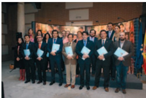
Los Alcaldes de las ciudades de la Red, en la sede de la FEMP tras su constitución.

Un total de 16 Ayuntamientos integran desde el pasado noviembre la Red de Infancia y Adolescencia, una iniciativa cuyo objetivo es garantizar los derechos de los menores y coordinar buenas prácticas en este ámbito. Entre otras cuestiones, la nueva Red trabajará para garantizar la protección de la intimidad de los menores, la promoción de valores éticos y de solidaridad y la denuncia de acciones que atenten contra los derechos de la infancia; asimismo, actuarán para promover intervenciones que tengan en cuenta la participación de los menores en la familia, la escuela y su municipio.