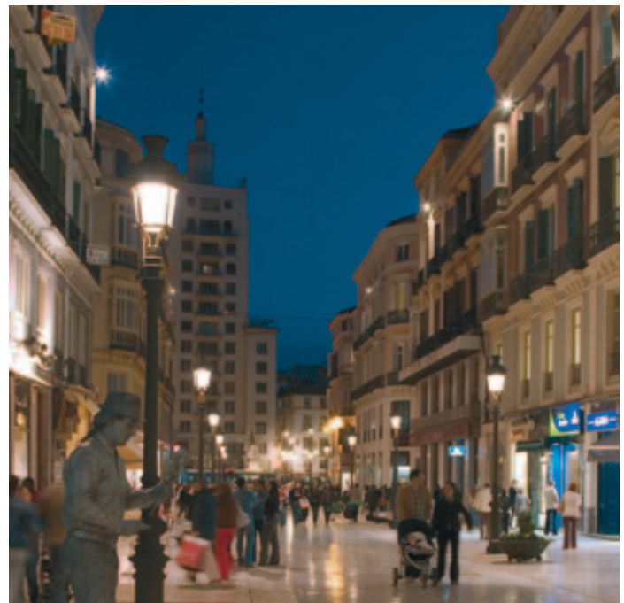
FEMP y MAGRAMA colaboran para impulsar nuevas tecnologías que ayuden a mejorar la eficiencia energética y la movilidad sostenible.