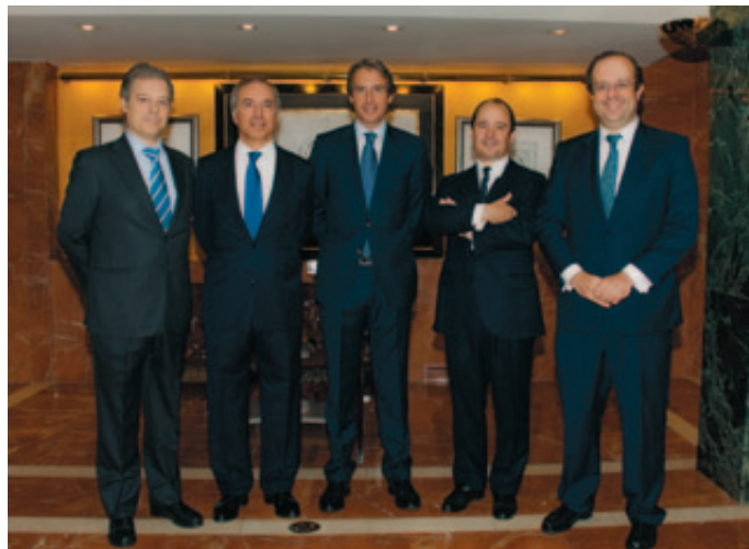
El Presidente de la FEMP junto a los patrocinadores del evento.

Finalmente, De la Serna destacó la enorme capacidad de las Entidades Locales para generar actividad económica, empleo y desarrollo, y apostó por la innovación, por la incorporación de