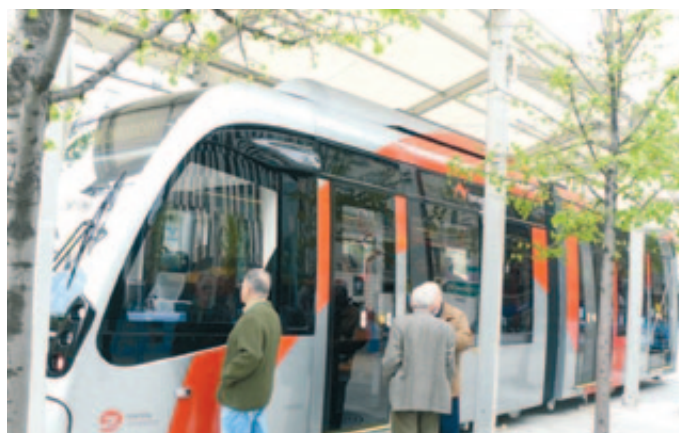
Tranvía de Zaragoza.

Mataró, el Consistorio finalista por su edificio de viviendas VPO de alquiler, gestó este proyecto con la finalidad de demostrar la compatibilidad entre la acción social que supone la promoción pública de vivienda de alquiler con un alto grado de sostenibili-