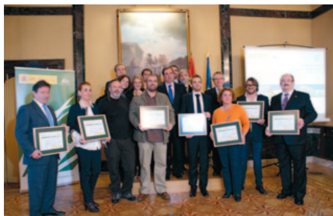
Los premiados posan tras recoger sus galardones.

Los galardonados en primero, segundo y tercer lugar recibieron premios por valor de 6.000, 4.000 y 2.000 euros,