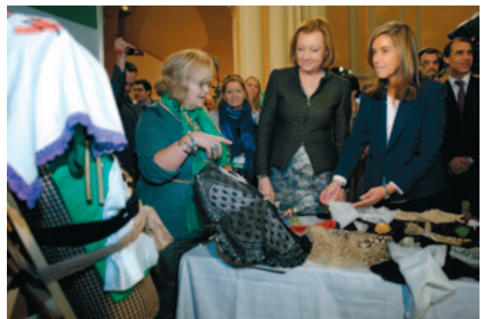
La Ministra Ana Mato y la Presidenta de Aragón, Luisa Fernanda Rudi, en los actos de clausura del Año Europeo del Envejecimiento Activo, celebrados en Zaragoza.

Durante este encuentro, la Ministra de Sanidad, Servicios Sociales e Igualdad, Ana Mato, anunció que el Gobierno