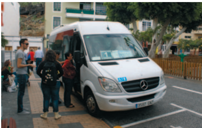
Taxi accesible en Candelaria (Tenerife).

El Plan, cuya puesta en marcha comenzó en 2006, estará plenamente implantado en 2015, cubriendo las necesidades de movilidad, con respeto al medio ambiente, al paisaje urbano y al patrimonio cultural. Las principales líneas de actuación han sido el tranvía (reconocido como mejor proyecto de integración urbana); el impulso al uso de la bicicleta (una iniciativa por la que la capital aragonesa ha recibido varios premios); los desplazamientos a pie y la potenciación del ahorro, la eficiencia energética y las energías renovables.