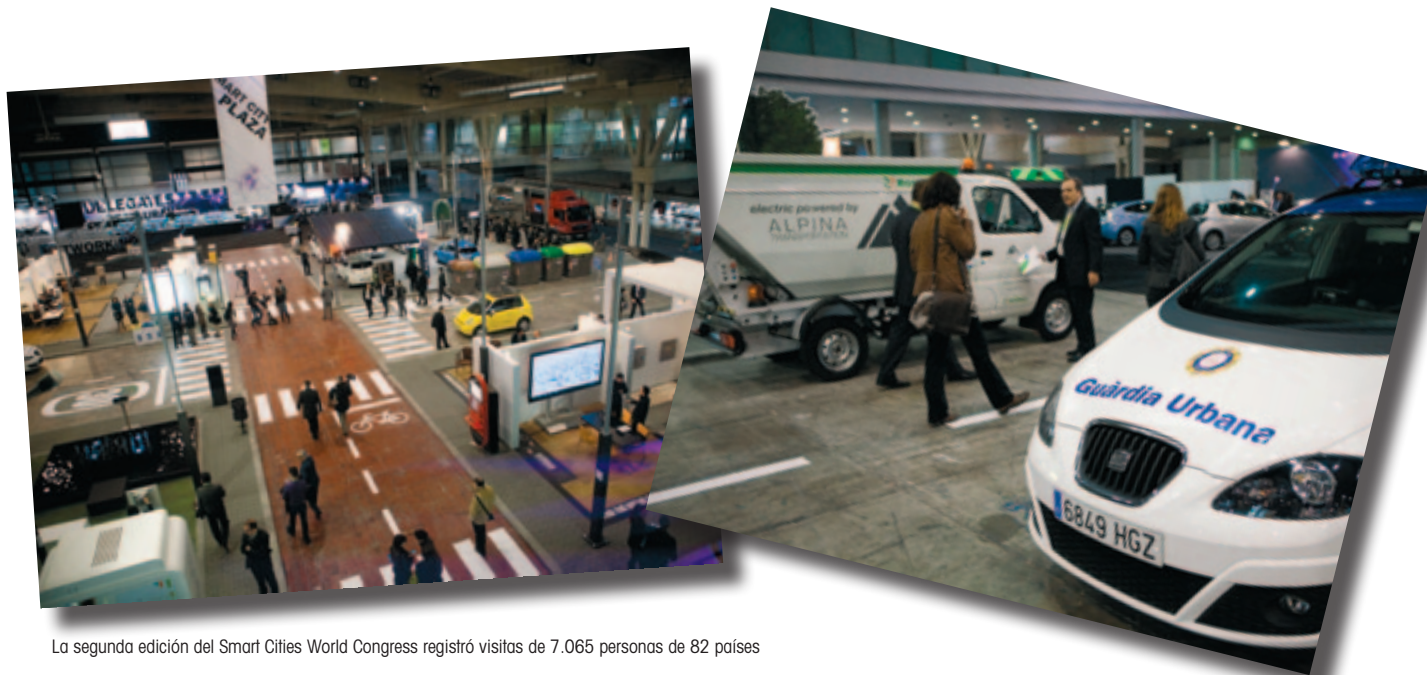
La segunda edición del Smart Cities World Congress registró visitas de 7.065 personas de 82 países

Las ciudades serán las grandes protagonistas del desarrollo mundial durante las próximas décadas por la capacidad de innovación de sus gobiernos, de sus habitantes y de sus empresas. Esta es una de las principales conclusiones de la segunda edición del Smart City Expo World Congress , celebrado en Barcelona del 13 al 15 de noviembre sobre eficiencia y ahorro energético.