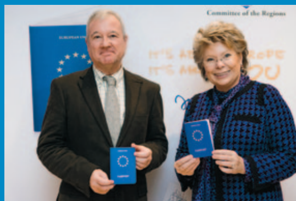
El Presidente del Comité de las Regiones y la Comisaria Reding muestran el simbólico “pasaporte europeo” presentado en el Foro.

Para Viviane Reding, el Año Europeo de los Ciudadanos es una oportunidad que tenemos para “escuchar y aprender cómo podemos construir juntos la Unión Europea del futuro”. “Las ciudades y regiones, los niveles de gobierno más próximos a los ciudadanos tienen un papel determinante que jugar en este proceso”, afirmó.