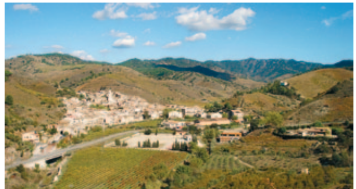
Panorámica de Porrera (Tarragona).

Los ganadores fueron seleccionados por un jurado compuesto de expertos, y con votaciones públicas emitidas por internet. A través de la red se presentaron 55 candidaturas y se emitieron 5.000 votos que los miembros del jurado tomaron en consideración.