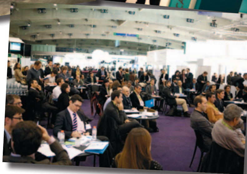
La parte congresual contó con 3.055 participantes y 319 ponentes.

En este marco, se presentaron 142 propuestas procedentes de Argentina, Dinamarca, España, Finlandia, Francia, Italia, Polonia y Estados Unidos. De los proyectos presentados, un 36% proceden del área de Tecnología Colaborativa e Innovación; un 14% del sector de la Energía; un 13% del ámbito de Ciudad Sociedad Inteligente; un 12% están relacionadas con la Movilidad; un 10% encuadradas en el sector de Medioambiente; las áreas de Gestión de Emergencias, Smart Geo y Urbanismo registran un 4% de las propuestas cada una; mientras que Gobernanza se lleva un 3%.