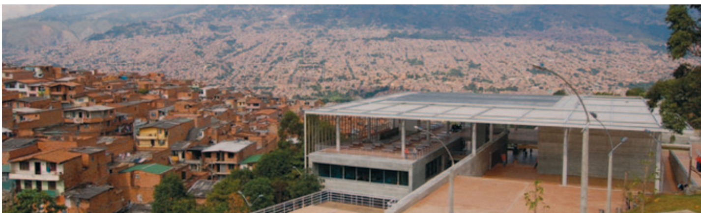
Impulsada junto a ONU Hábitat, la iniciativa Ciudad-Ciudad pretende facilitar el encuentro entre municipios de ambos lados del Atlántico para establecer alianzas institucionales y técnicas. En la imagen, panorámica de Medellín (Colombia).

La FEMP y ONU-HABITAT, el programa de Naciones Unidas para los Asentamientos Humanos, han presentado la iniciativa para la cooperación descentralizada Ciudad-Ciudad, enmarcada en el proyecto sobre apoyo a la planificación urbana municipal a través de la cooperación descentralizada.