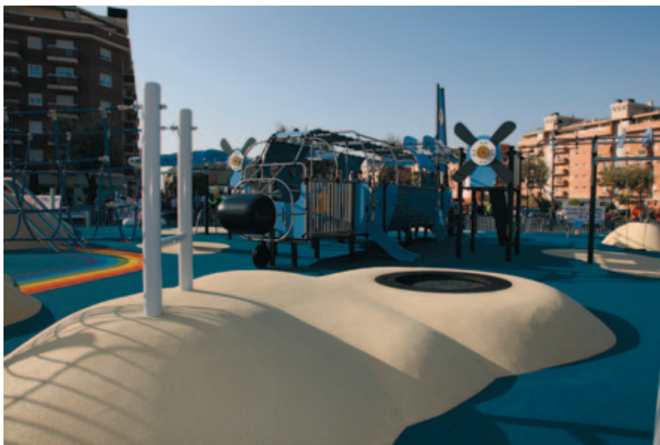
Parque Aviocar, de Getafe, ganador del Columpio de Oro.

A finales de noviembre tuvo lugar en Zaragoza la entrega de premios del III Concurso de Áreas de Juegos Infantiles, convocado por la Feria de Zaragoza y la Asociación Española de Fabricantes de Mobiliario Urbano y Parques Infantiles.