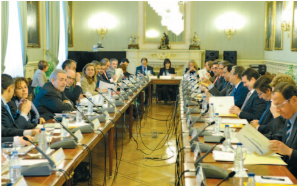
Representantes del Ministerio de Hacienda y Administraciones Públicas y de la FEMP, durante una reunión de la CNAL.

que los Ayuntamientos son la Administración que más y mejor están cumpliendo con las