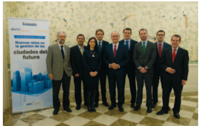
Ponentes y organizadores del Foro, antes de la apertura del mismo.

Para Íñigo de la Serna, Smart City no es sólo una moda, sino algo que hace que las ciudades progresen: "Tenemos empresas y tecnologías para poder competir, y estamos haciendo esfuerzos" . La Red que integra a las Smart Cities españolas, y que preside la ciudad de Santander, ya tiene 29 miembros que, según explicó, trabajan de una manera solidaria, intercambiando y compartiendo experiencias entre ellas, lo que supone un importante ahorro.