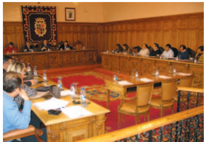
Imagen del taller celebrado en Palencia el pasado 19 de noviembre.

El acceso a instrumentos financieros de la Unión Europea para financiar la cooperación descentralizada (tales como el Programa Temático Actores No Estatales y Autoridades Locales en el desarrollo), o la participación en otros programas como la Plataforma ONU-Hábitat, fueron cuestiones que despertaron el interés de los asistentes, como también ocurrió con el manual para la Gestión de la Cooperación al Desarrollo de los Gobiernos Locales y la plataforma on-line de cooperación de la FEMP. ★